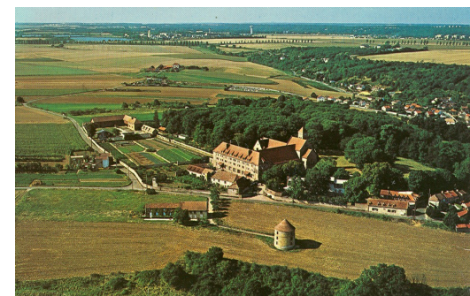
*Abbaye Saint-Louis du temple sur le Plateau de Saclay

1 Eglise Saint Rigomer, Sainte Ténestine, chapelle primitive agrandie au 13 e siècle, restaurée au cours des siècles (MH* 1927) ; crypte des années 530.